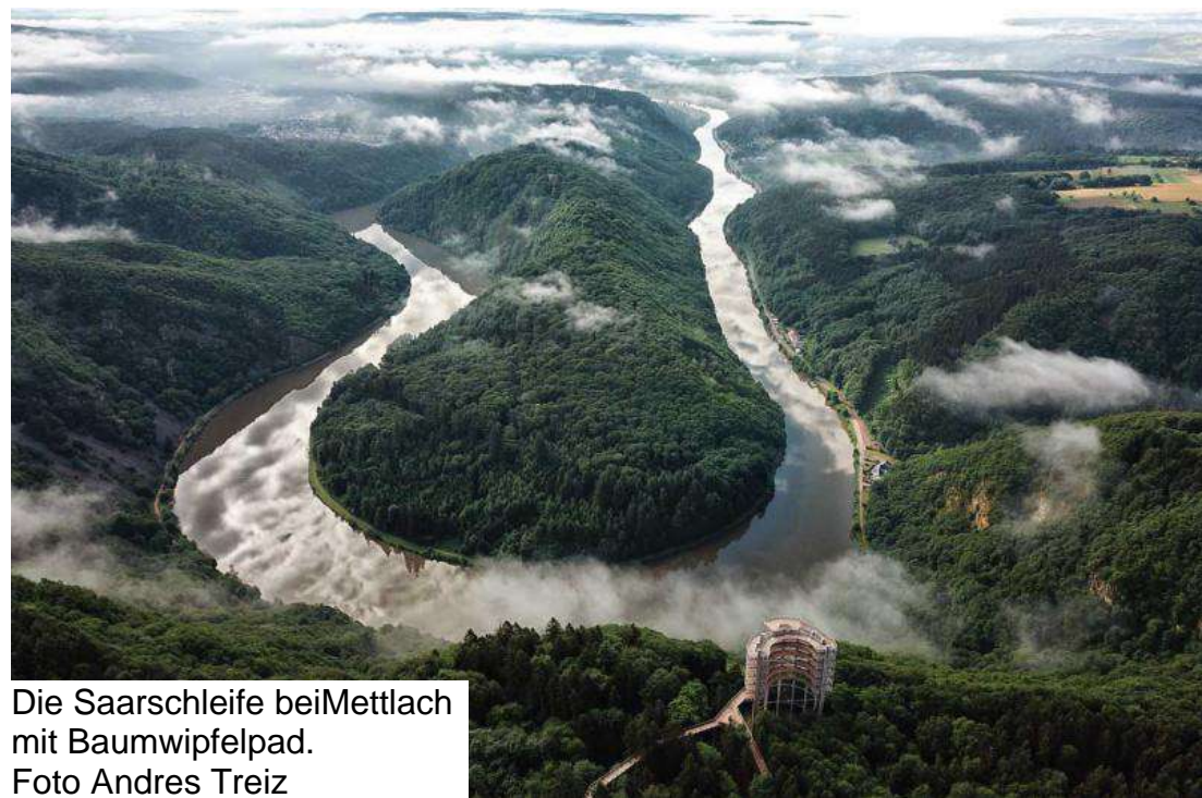
Die Saarschleife bei Mettlach mit Baumwipfelpfad.

Wie Ihr festgestellt habt, hat die Corona Pandemie uns immer noch im Griff. Alle geplanten Termine konnten nicht umgesetzt werden. Wenn alles gut geht können wir im September den Film “Die Saar, von der Quelle bis zur Mosel” zeigen. Auch unsere Vereinsfahrt nach Tholey kann im Spätsommer stattfinden. Die wöchentlichen Kaffeemittage werden wir wieder aufnehmen, sobald die Auflagen der Regierung aufgehoben werden. Bis dann: Bleibt gesund und passt auf Euch auf! Der Vorstand.