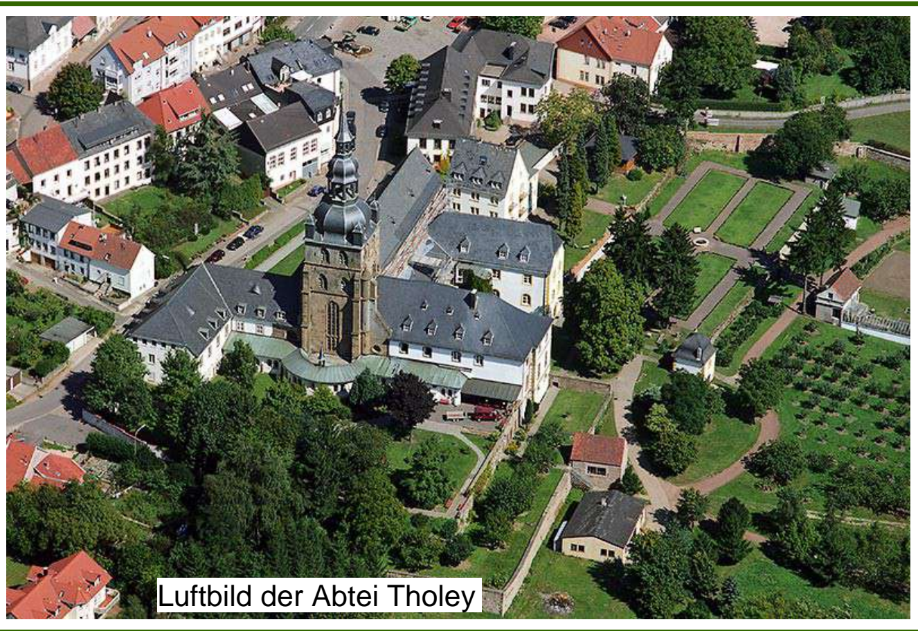
Luftbild der Abtei Tholey