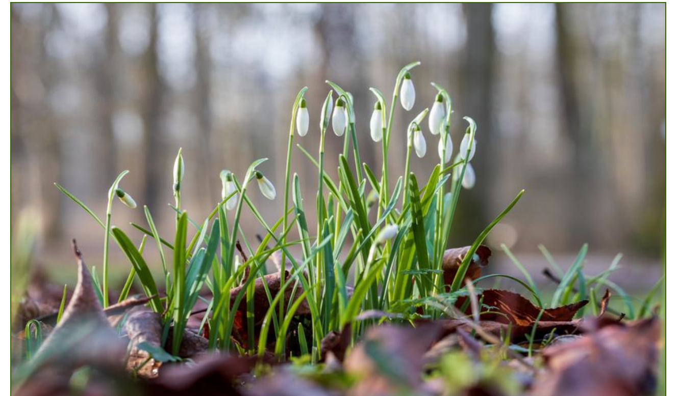
Aufnahme im Januar 2023 im Stadtgarten Saarlouis, Foto: Klaus Maurer.